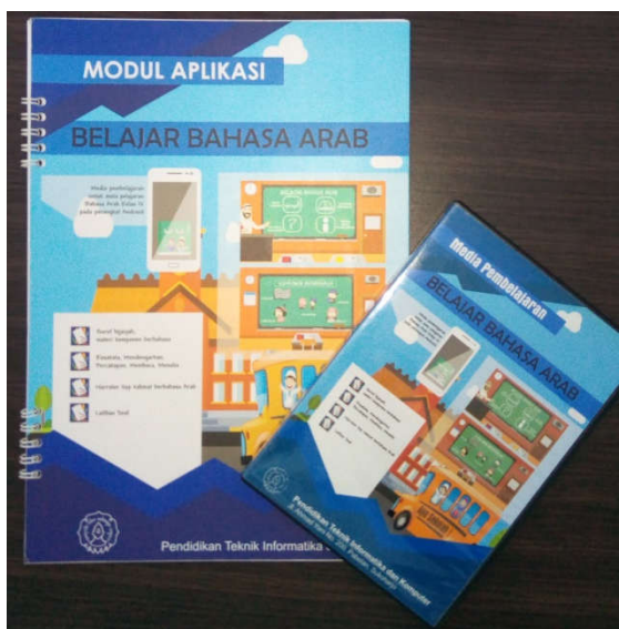
Contoh CD Software + Buku Panduan